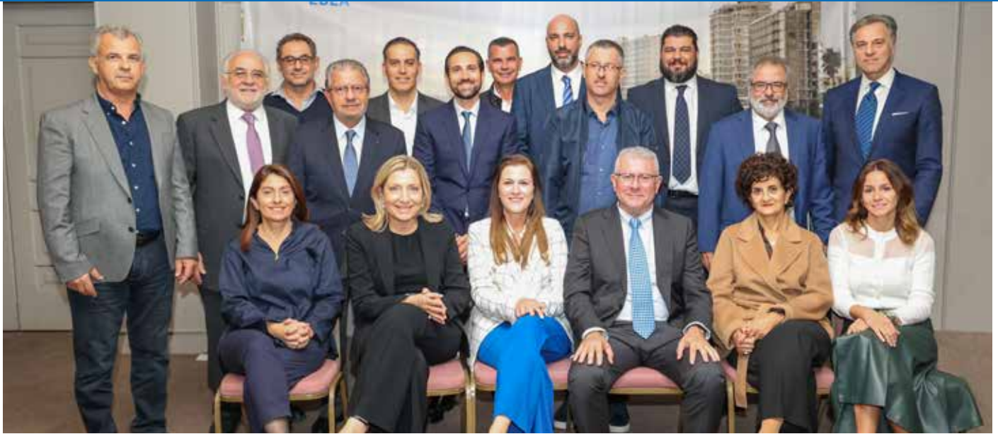
Το Διοικητικό Συμβούλιο του ΕΒΕ Αμμοχώστου