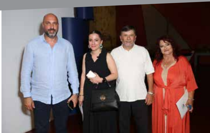
Τουρκική εισβολή του 1974 στις 18 Ιανουαρίου 2023.

Η λειτουργία της προσωρινής Δημοτικής Πινακοθήκης Αμμοχώστου αποτελεί ορόσημο στην ιστορία της Αμμοχώστου αφού από τον Μάιο του 1959 που η Δημοτική Πινακοθήκη άνοιξε τις πόρτες της στο κέντρο της πόλης, άνοιξε και πάλι τις πύλες της μετά την