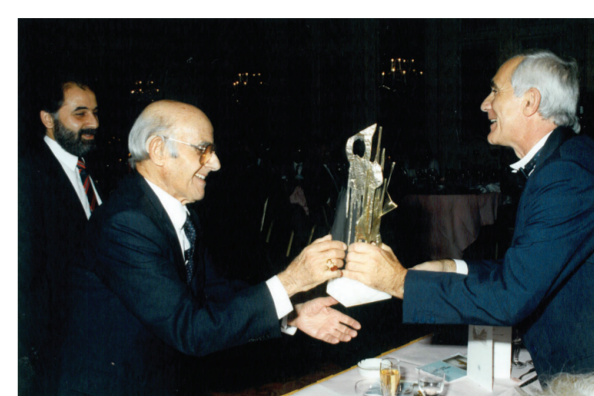
Αρκετά βραβεία βρίσκονται στις βιτρίνες του Ομίλου. Η φωτογραφία από την απονομή του INTERNATIONAL CONSTRUCTION AWARD, Παρίσι 1989.