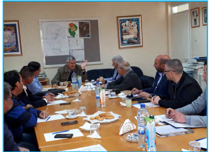
Στιγμιότυπα από τις συναντήσεις