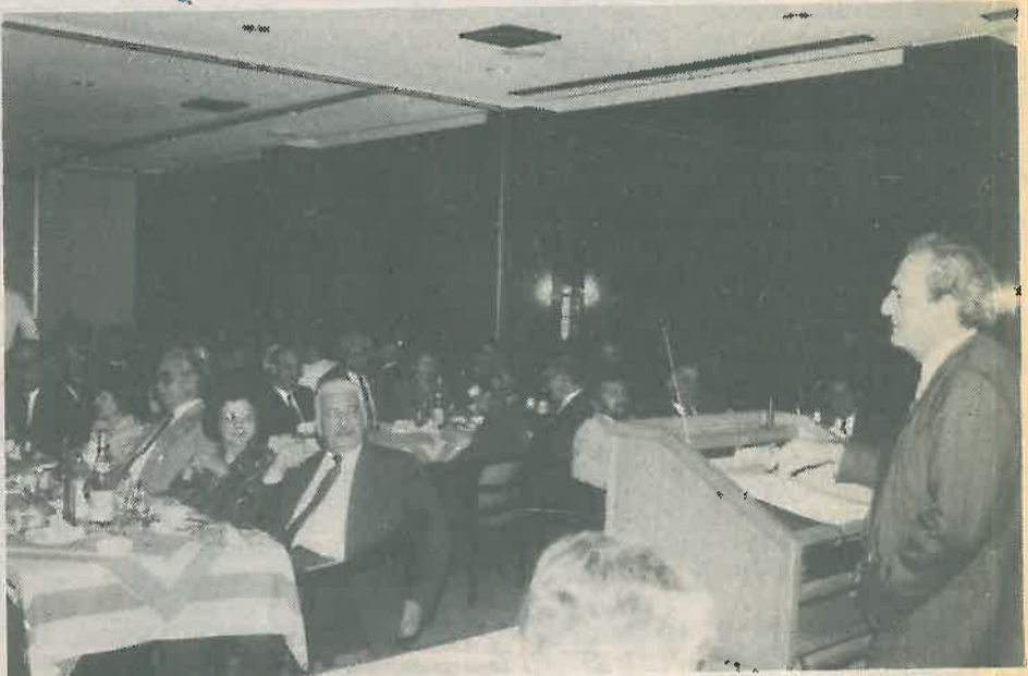
Ο Υπουργός Οικονομικών μιλά στη συνεστιάση του ΕΒΕΑ