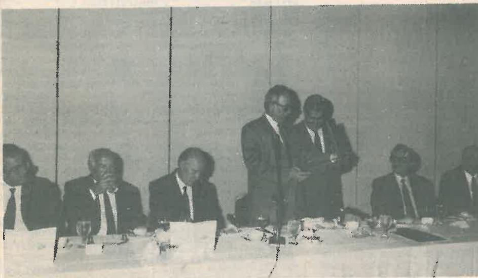
Φωτογραφικό στιγμιότυπο από την εκδήλωση που οργάνωσε το ΚΕΒΕ για να τιμήσει τον πρώην Πρόεδρο του Ανδρέα Αβρααμίδη σ' αναγνώριση της ανιδιοτελούς προσφοράς του στο Επιμελητήριο και τον τόπο γενικότερα. (Δεξιόμεριες στην 3η σελίδα).

Τη στιγμή αυτή του προβληματισμού και της εκτίμησης, το 1990 προβάλλει σαν χρόνος ιδιαίτερα σημαδιακός για μας, με την οριστική επιλογή της πορείας μας προς τη μεγάλη Ευρωπαϊκή Κοινότητα, που τεράτισε αμφιταλαντεύσεις και αμφιβολίες και μας έβαλε αποφασιστικά στη σωστή τροχιά για σταθερή και ασφαλή ευημερία και πρόοδο στην πλατειά κοινωνία των Ευρωπαϊκών χωρών.