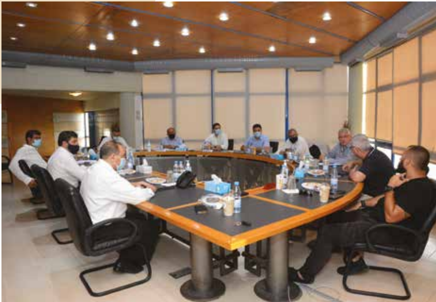
Στιγμιότυπο από τη συνάντηση με βουλευτές της Αμμοχώστου