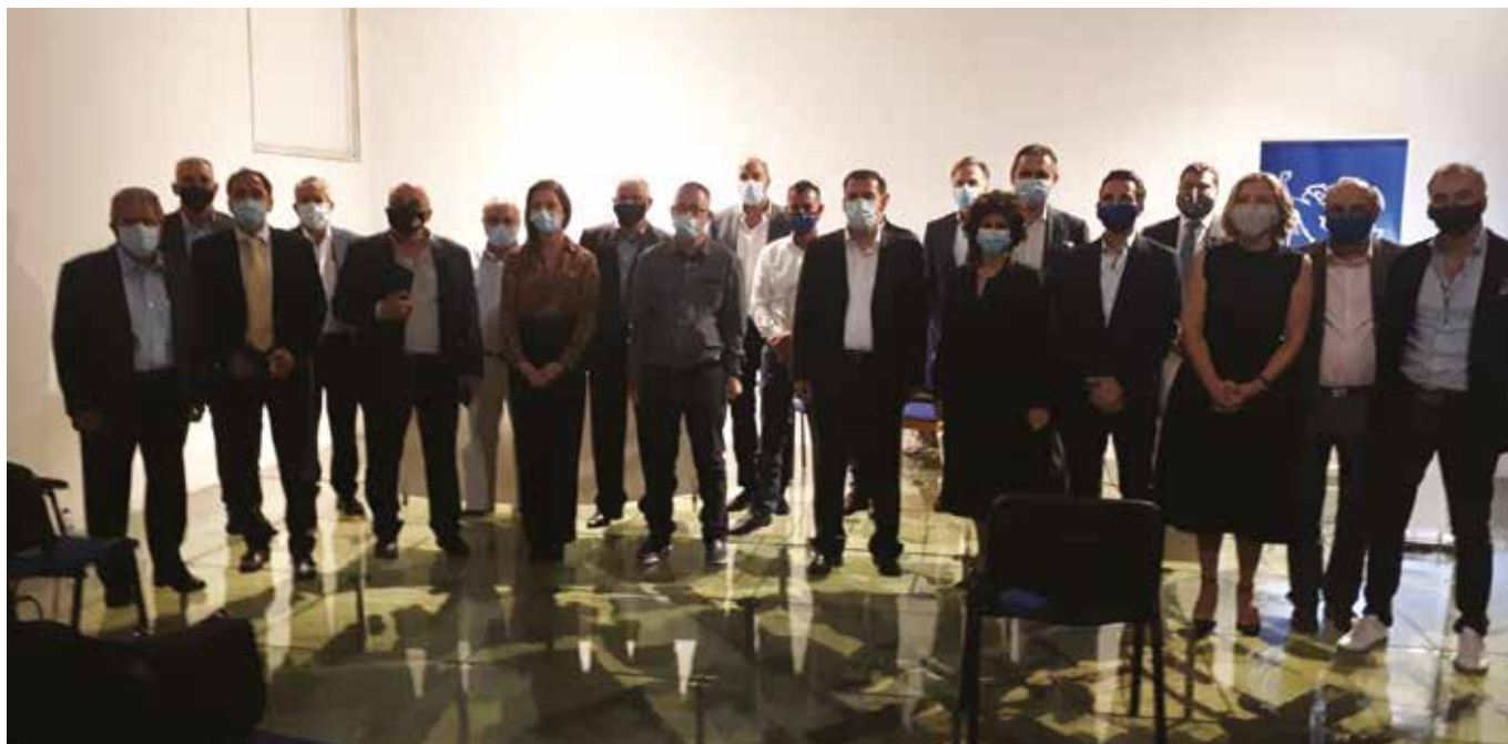
Το Διοικητικό Συμβούλιο του ΕΒΕ Αμμοχώστου