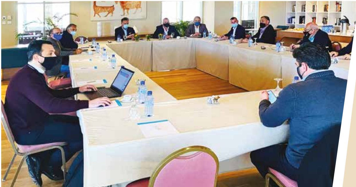
Στιγμιότυπο από τη σύσκεψη για τα θέματα τουρισμού στην Αμμόχωστο