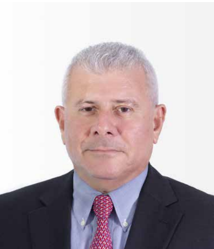
Ο Αυγουστίνος Παπαθωμάς Πρόεδρος του ΕΒΕ Αμμοχώστου