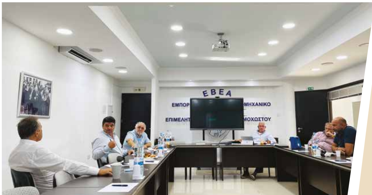
Συνάντηση του Επιμελητηρίου Αμμοχώστου με τον Δήμαρχο Αγίας Νάπας