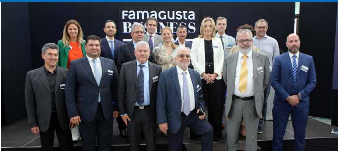
Το Διοικητικό Συμβούλιο του ΕΒΕ Αμμοχώστου