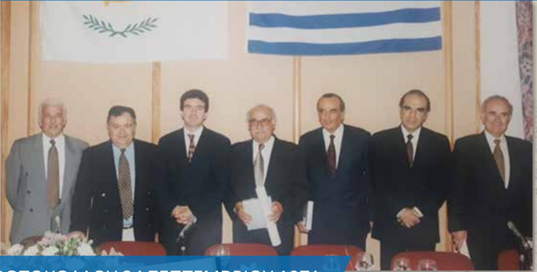
ΥΠΟΓΡΑΦΗ ΠΡΩΤΟΚΟΛΛΟΥ 24 ΣΕΠΤΕΜΒΡΙΟΥ 1971