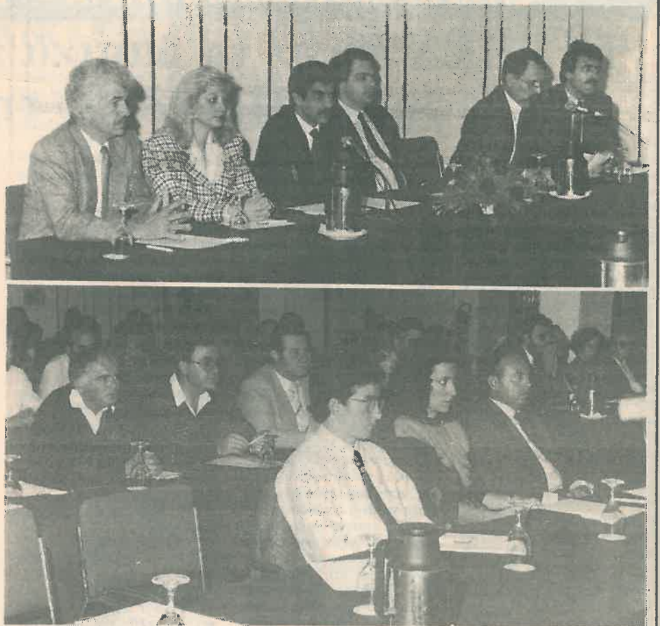
Πάνω από εβδομήντα στελέχη επιχειρήσεων παρακολούθησαν το πρώτο σεμινάριο για το Φόρο Προστιθέμενης Αξίας που διοργάνωσε το ΕΒΕΑ σε συνεργασία με το ΚΕΒΕ και το Υπουργείο Οικονομικών. Το Σεμινάριο δίδαξαν αρμόδιοι λειτουργοί του Υπουργείου Οικονομικών και απάντησαν σε πάρα πολλές ερωτήσεις που αφορούσαν την εφαρμογή της νέας Φορολογίας στην πράξη.